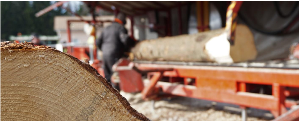
Sirkkeli Ripatti & Jatkola

Ensimmäisten viikkojen aikana yrityksiin suunnatuissa tarvekartoituksissa on pohdittu esimerkiksi perinteisen puunjalostuksen uusia mahdollisia jakelukanavia, sekä edistetty osaltamme kehitystoimenpiteitä mm. uusiin, biojalostuksen menetelmillä valmistettuihin tuotteisiin. Puhelinkierroksella ja tarvekartoituksien yhteydessä on välitetty tietoa nopeasti muuttuneista yritysten kehitysrahoitusmahdollisuuksista, ja ensimmäiset hakemukset ovat meidänkin toiminta-alueelta parhaillaan mukana käsittelyjonossa. Kuntapäätäjille suunnattu avajaisseminaari siirtyi, eikä hankkeessa toteutettavalle kuntakierrokselle saatu niin näkyvää alkua kuin oli suunniteltu, mutta työt saatiin kuitenkin käyntiin myös tässä työpaketissa.