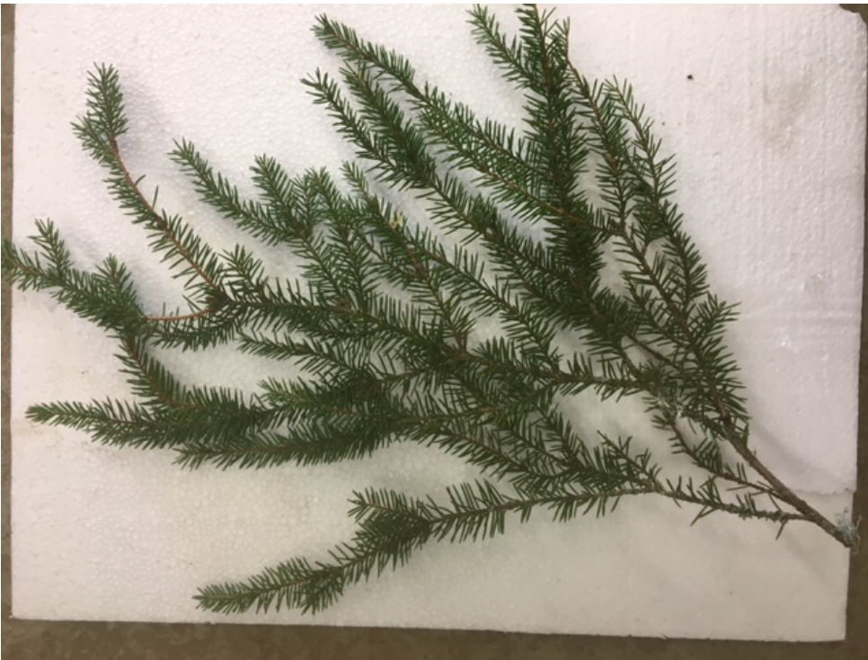
Huono köynnöshavu. Harva, neulasia puuttuu, jäkälää.