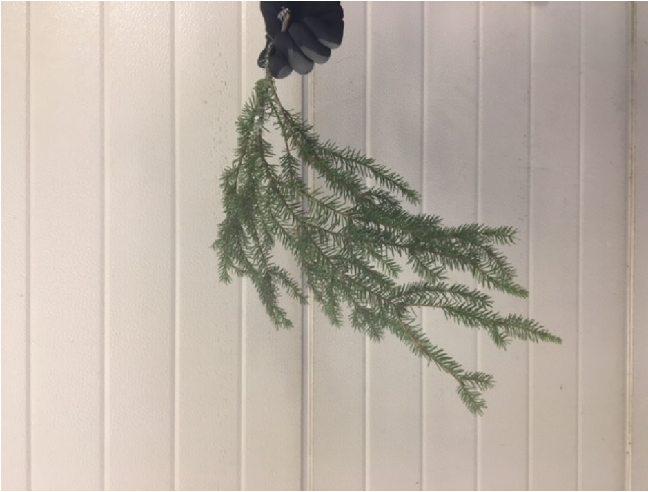
Huono köynnöshavu. Roikkuva, ei ryhdikäs.